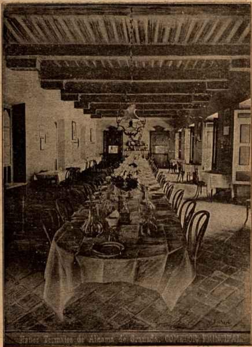
Hotel Terraces de Alcala de Juana de los Rios, Pinar del Rio, Cuba