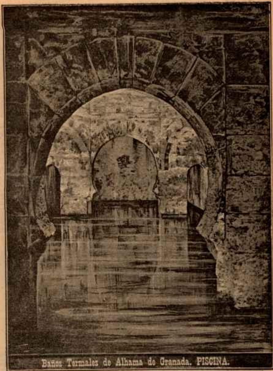
Baños Termales de Alhama de Granada. PISCINA.